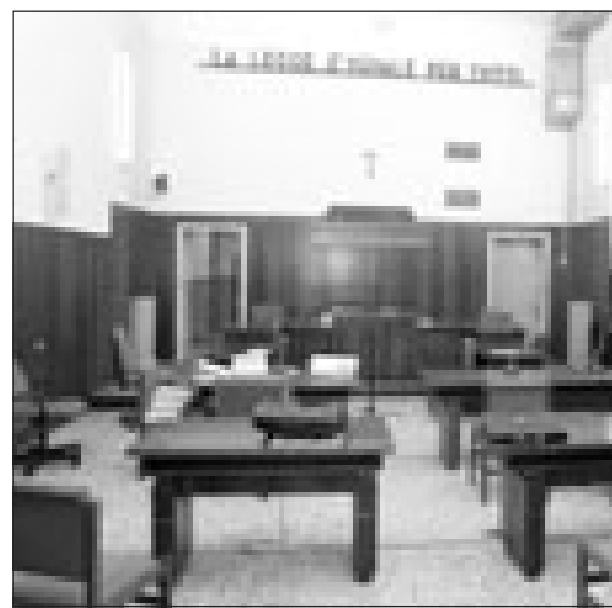
Un'aula del Tribunale